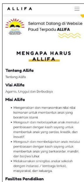
Gambar 4 Halaman Beranda

Rancangan website yang dibuat responsive sehingga website ALLIFA dapat diakses sesuai dengan preferensi pengguna, yaitu melalui smartphone . Rancangan website responsive memungkinkan pengguna untuk mengakses dengan nyaman, termasuk menu yang dibuat dengan teknis burger-menu . Hal ini memberikan ruang bagi pengguna sehingga informasi dapat diakses dengan maksimal. Penggunaan warna dominan disesuaikan dengan brand dari PAUD Terpadu ALLIFA. Kombinasi warna yang lain, melibatkan teori kombinasi warna yang baik sehingga tampilan website dapat diterima pengguna (Santosa, 2009).