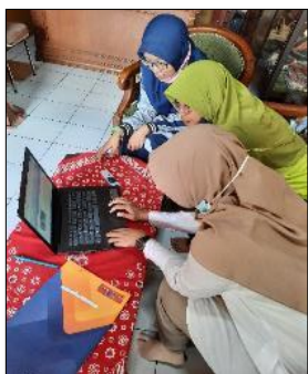
Gambar 7 Pelatihan Admin

Selanjutnya evaluasi dari kegiatan sesuai dengan permasalahan yang telah disepakati. Pada tahapan ini, metode pelaksanaan dievaluasi sesuai dengan kegiatan pengabdian masyarakat yang dilakukan. Hasil evaluasi dijabarkan pada Tabel 5.