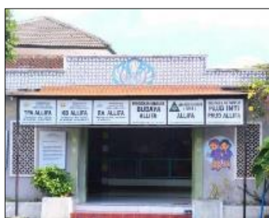
Gambar 1 PAUD Terpadu ALLIFA

Website merupakan salah satu media promosi yang dapat dimanfaatkan di berbagai bidang, salah satunya pada bidang pendidikan. Institusi pendidikan memanfaatkan teknologi informasi sebagai pendukung keberlangsungan operasional, yaitu ketersediaan informasi, sumber belajar, sampai dengan media promosi. Website juga dapat berperan sebagai media komunikasi dalam menyampaikan informasi yang dinilai relative murah, mudah, interaktif, dan fleksibel. Dalam hal ini, website tidak hanya diakses dengan menggunakan perangkat komputer, tetapi dapat diakses dengan menggunakan perangkat mobile (Febryantahanuji, 2017)(Wirytinoyo et al. , 2020). Selain itu, ketersediaan website dapat digunakan untuk penguatan citra dan branding sebuah institusi. Akan tetapi, untuk menjaga keberlangsungan dan konsistensi sebuah website , diperlukan sebuah pengelolaan website yang konsisten dan berkelanjutan. Selain itu, ketersediaan sumber daya manusia untuk pengelolaan website sebagai penunjang institutional branding dibutuhkan untuk mendukung keberlanjutan arus informasi (Lendriyono, Kusumaningrum and Hardiyanti, 2019).