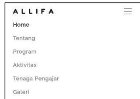
Gambar 3 Menu pada Website ALLIFA

dan database, sehingga dapat dihasilkan sebuah website yang sesuai dengan kebutuhan pengguna. Gambar 3 dan Gambar 4 adalah halaman utama ketika website dibuka dengan menggunakan smartphone .